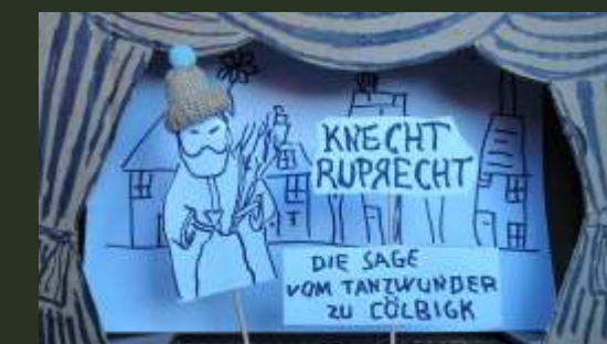
M!PÖRT - Tanzwunder

16:30 - 17:00 Uhr Konzert Amici Carminis im Foyer des Rathauses II