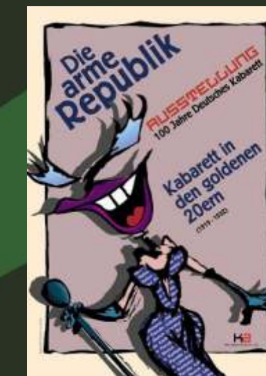
Ausstellung im Kabarettarchiv