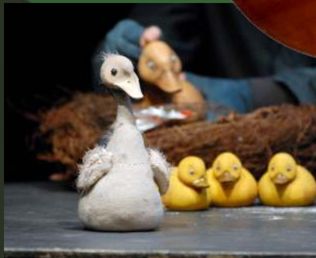
Das hässliche Entlein